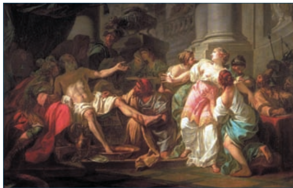
Jacques-Louis David - La Morte di Seneca (1773)

I dati delle Schede di dimissione ospedaliera - Sdo (comunque imprecisi in quanto codificano principalmente i sintomi e non le cause) non includono le prestazioni per intossicazioni acute fornite nei servizi d'urgenza e non seguite da ricovero (circa 500mila/anno) e quelle ambulatoriali (per problematiche croniche). Tutto ciò suggerisce che i numeri delle patologie tossiche non siano inferiori a quelli di altre specialità mediche per le quali il Ssn prevede strutture cliniche di diagnosi e cura.