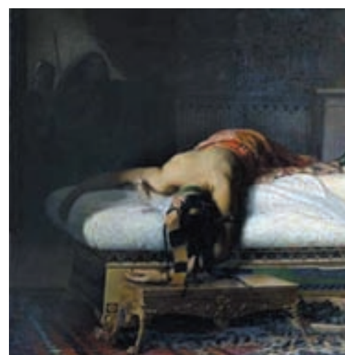
Jean André Rixens - La morte di Cleopatra (1874)

altri enti istituzionalmente competenti;